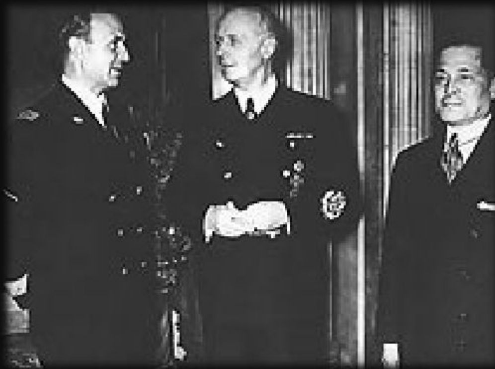
Министры иностранных дел стран «Антикоминтерновского пакта».

Слева направо: Г. Чиано (Италия), И. Риббентроп (Германия), Х. Осима (Япония)